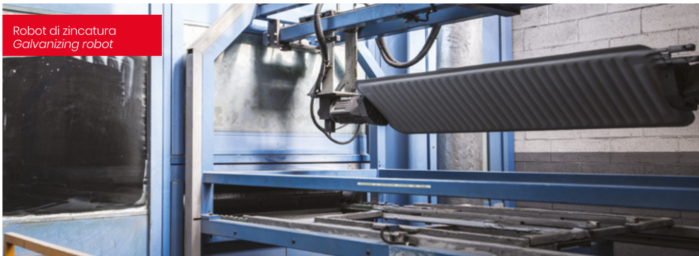
Robot di zincatura Galvanizing robot