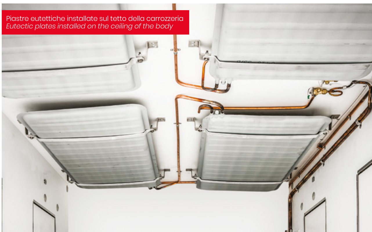
Piastre eutettiche installate sul tetto della carrozzeria Eutectic plates installed on the ceiling of the body

Low temperature transport and distribution of products such as ice-cream and frozen food , must comply with several needs maintaining efficiency and granting the cold chain .